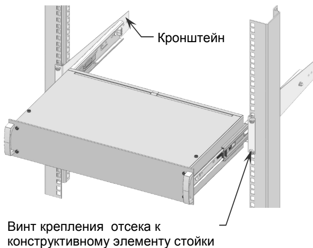
Рисунок 2 - Пример встраивания отсека в телекоммуникационную стойку