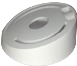
DS-1259ZJ Потолочное крепление