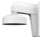
DS-1272ZJ-110 Настенный кронштейн