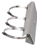
DS-1275ZJ Крепление на столб